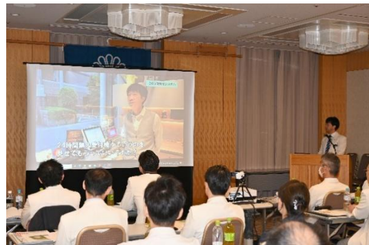
写真はいずれも 2023 年に開催した第 1 回クリニシュランの様様